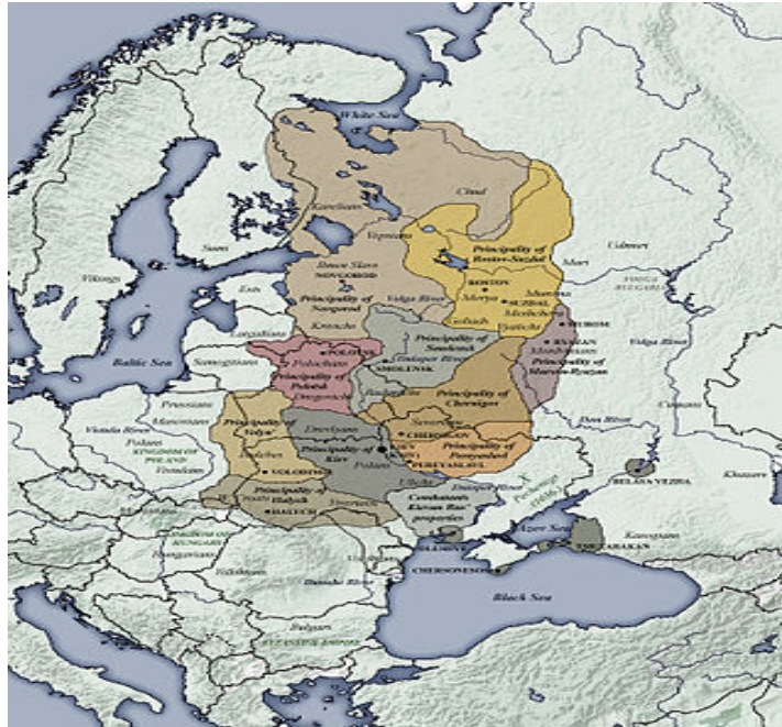
Los principados de Kievan Rus después de la muerte de Yaroslav I en 1054 2

Como Polonia emprendió una política de polonización en Ucrania, los cosacos de Ucrania Central y Oriental se rebelaron contra la Mancomunidad polaca-lituana en 1648 y firmaron un tratado con Rusia en 1654 en Pereyaslav. El posterior tratado de Andrusovo de 1667 definió los límites entre Rusia que se quedó con el Left Bank Ukraine y la Mancomunidad con el Right Bank Ukraine (márgenes oriental y occidental del río Dniepr). Kiev quedó bajo el control de Moscú aunque está en la margen occidental. Así se fueron consolidando dos elementos de la identidad ucraniana, una que mira a Rusia en la parte central y oriental y otra que mira a la Mancomunidad en la parte occidental. Los repartos de Polonia-Lituania en 1772, 1793 y 1795 entre Prusia y Rusia que participaron de los 3 y Austria que participó del primero y el último afectaron a Ucrania. Rusia anexó el Right Bank Ukraine y la parte occidental quedó bajo control austríaco. Se produjo un renacimiento cultural ucraniano en la Ucrania rusa, que fue reprimido por Rusia con sus políticas de rusificación (Subtelny, 2000: 55-65, 69-80, 139-177).